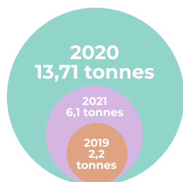
Poids du matériel médical collecté